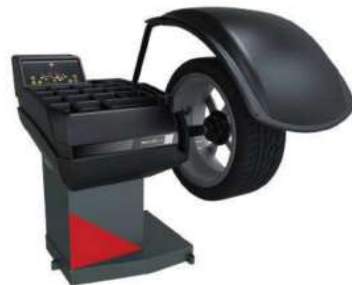
Equilibradora 3618 LA-KP

Con palpador automático, sonar y capot de protección